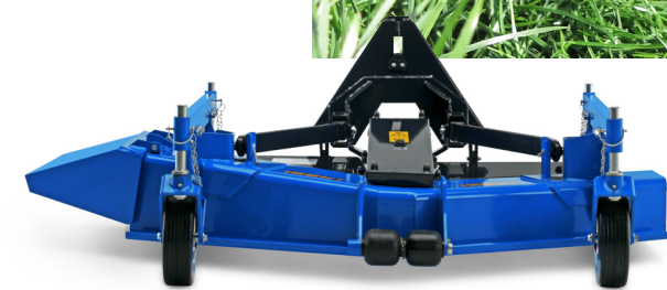
Opcjonalna kosiarka przednia z systemem szybkiego montażu